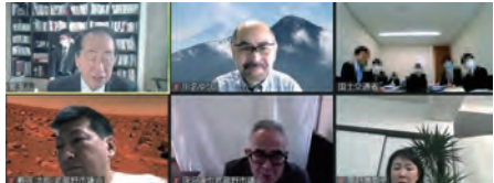
▲立憲民主党の武蔵野市議(深沢・川名・蔵野・敷原)と実施した、国土交通省オンラインヒアリングの様子。

昨年10月、調布市内の住宅地で起きた外環道トンネル工事による道路陥没事故に驚いた方は多いと思います。今後武蔵野市内での 工事も予定 されており、2度にわたって国土交通省と東日本高速道路から説明を受けました。